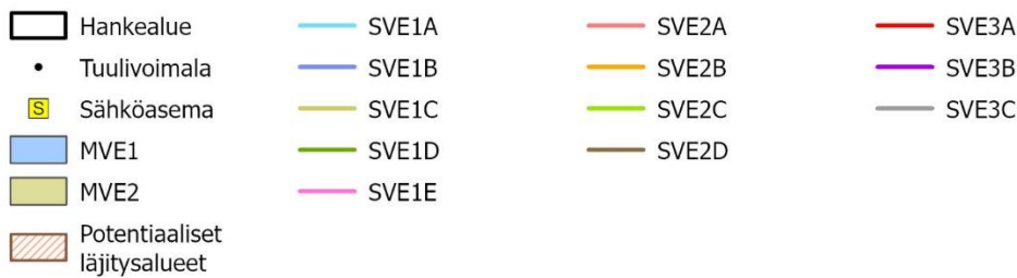
Kuva 1. Korsnäsin merituulivoimapuiston hankealue (VE1, 150 tuulivoimalaa), potentiaaliset meriläjäytysalueet ja merikaapeleiden tutkimuskäytävät (MVE1 ja MVE2) sekä sähkönsiirtoreitit (SVE1-3) mantereella (lähde: Metsähallitus ja Vattenfall, Korsnäsin merituulivoimapuiston sähkönsiirto mantereella YVA-ohjelma).