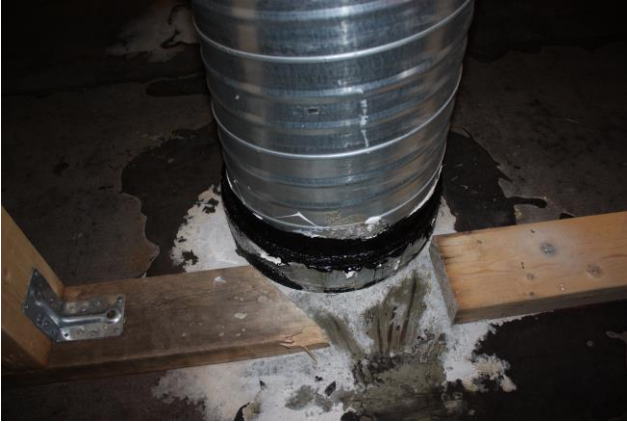
Käsityön yläpohjan läpivientien tiivistys