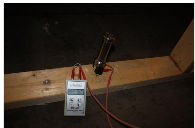
Käsityön yläpohjan puurungon kosteusmittaus