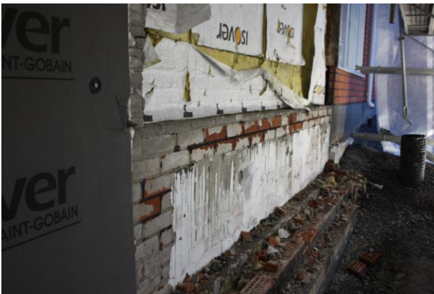
Vanha korjattava ulkoseinä