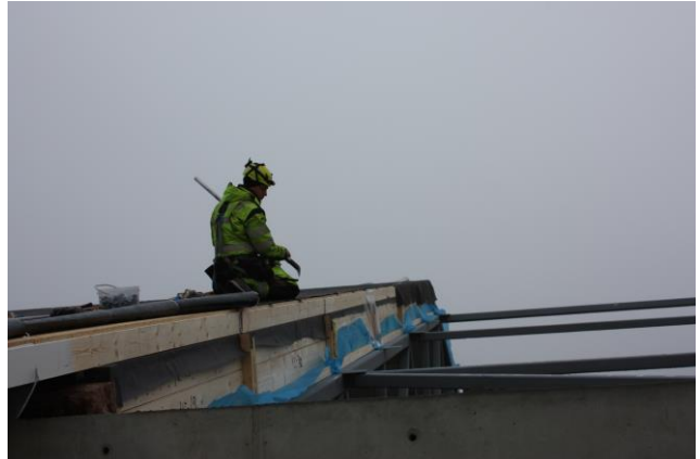
Liikuntasalin kattoelementtien asennusta