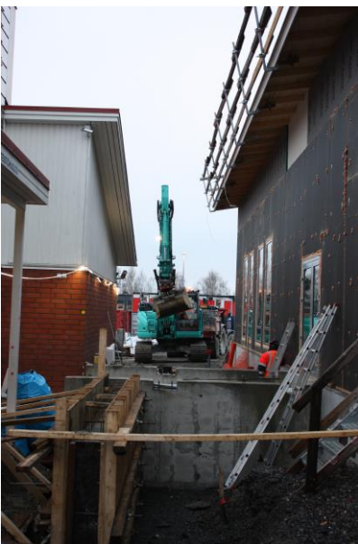
Käsityön liitoskäytävä vanhaan