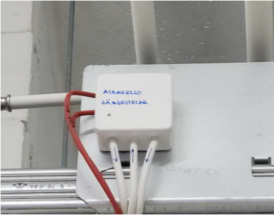
Jakorasioiden ja kaapelien merkinnät ovat siistejä ja selkeitä