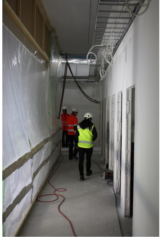
P1-alueen tarkastus yläasteella