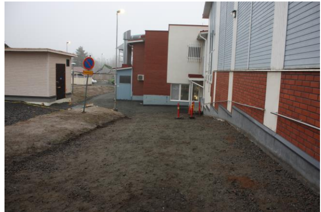
Korjattu luiska keittiön ulko-ovella