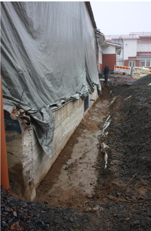
Vanhan sokkeli ja salaojan uusiminen