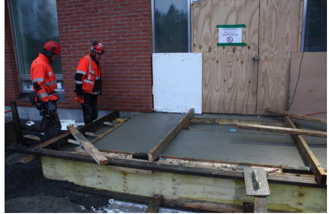
Yläasteen eteläsivun porraskatos