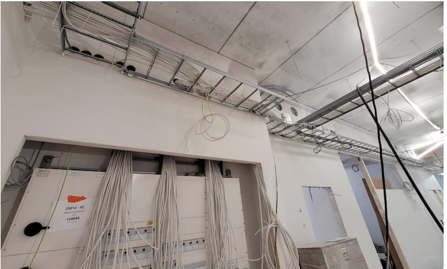
C-osalla kaapelointi pitkällä ja osa keskuksista jo paikoillaan