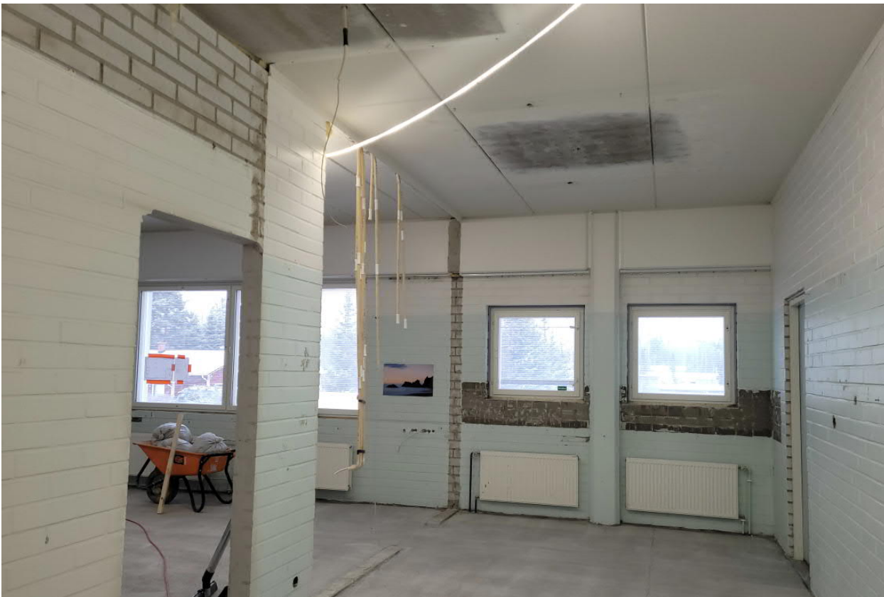
Saneerauspuolta 2. krs