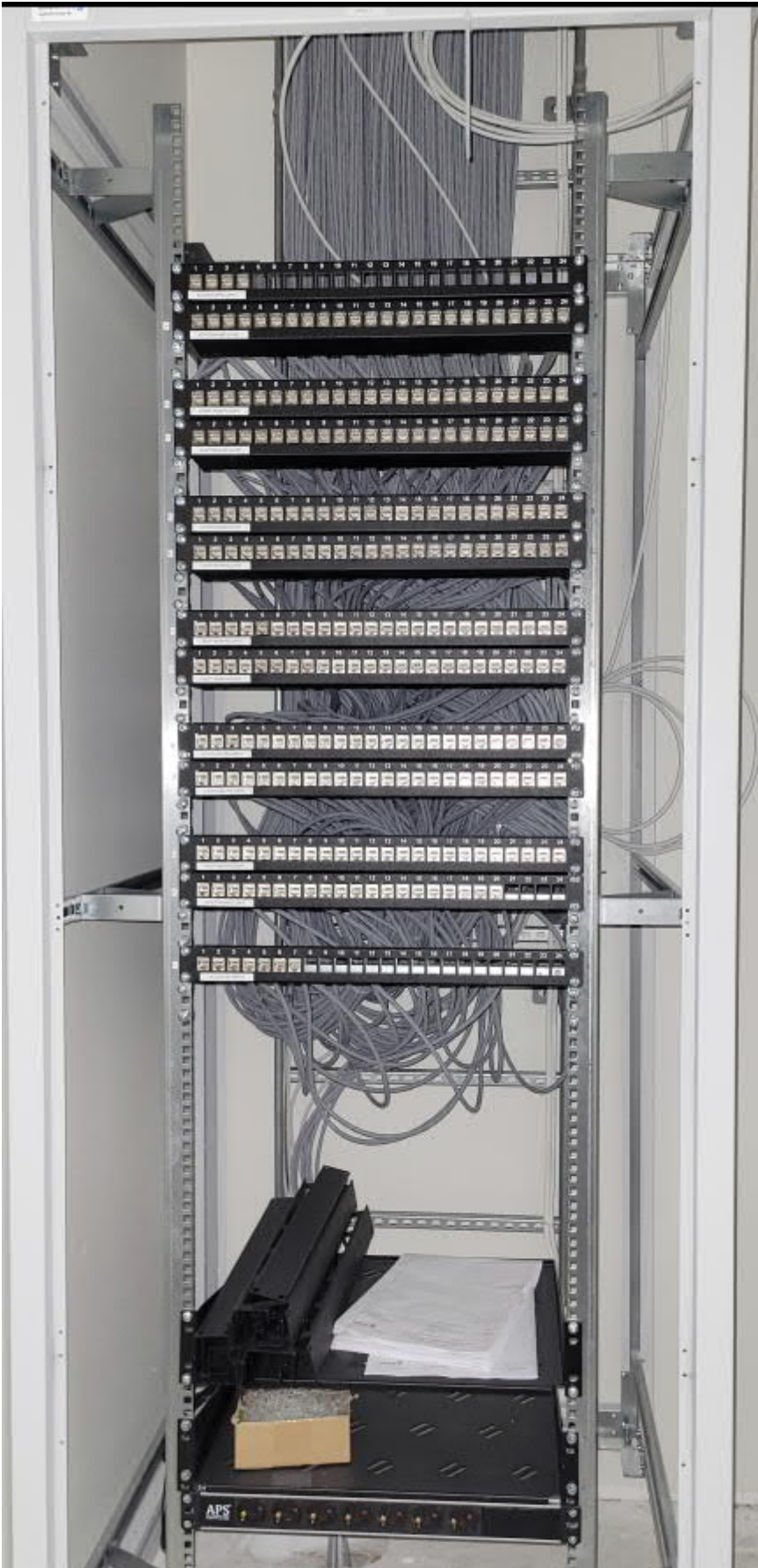
C-osa 1. krs yleiskaapelointiräkki. Vaikka ollaan puhtaalla puolella, olisi nuo liittimet hyvä pölysuojata.