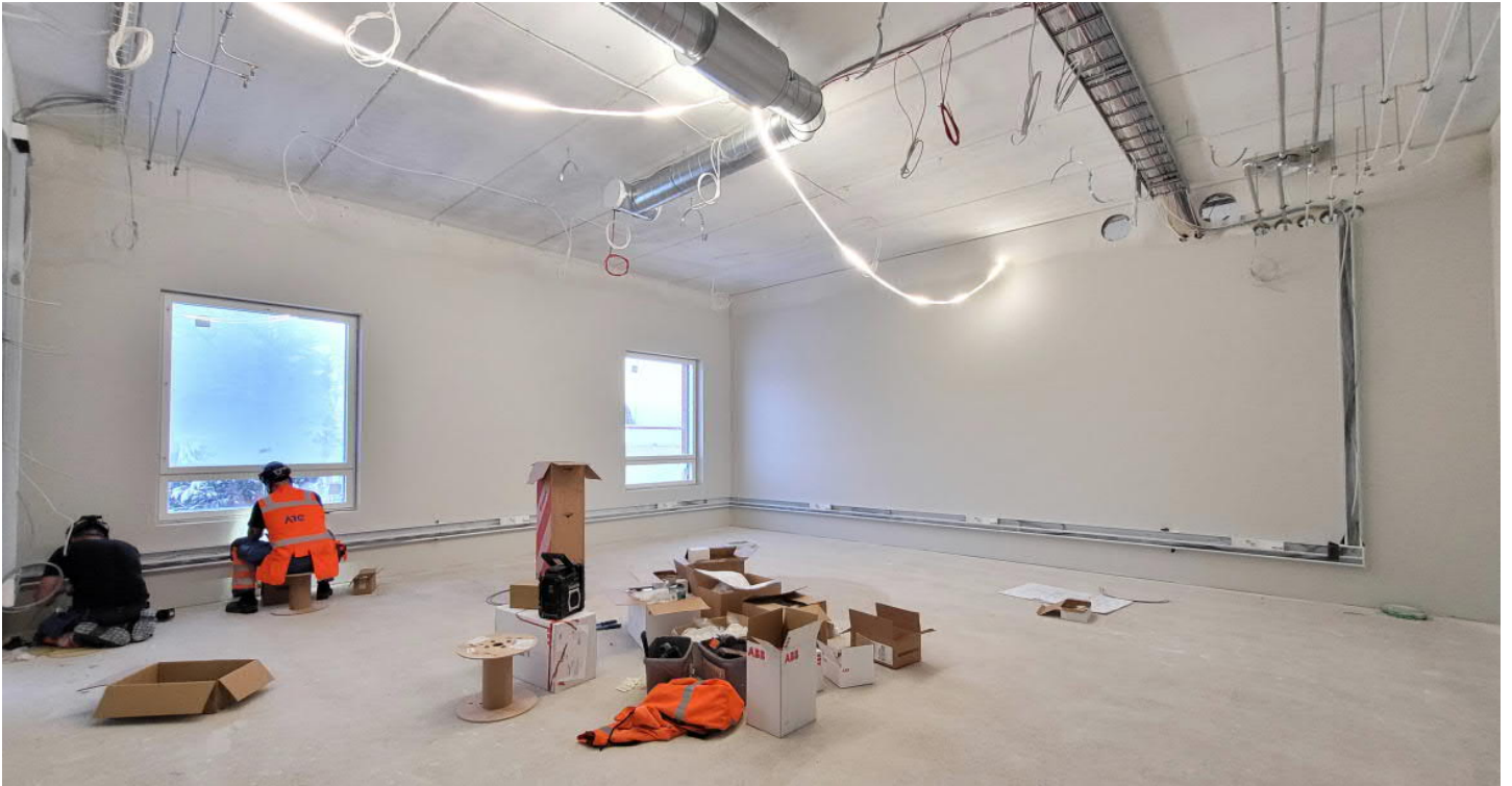
C-osalla 2. kerroksessa on kouruasennukset käynnissä