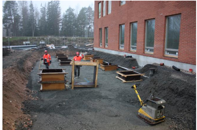
Yläasteen sivukatoksen anturamuotitus