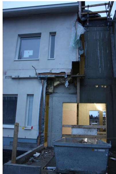
Liikuntasalin liitoskohta vanhaan