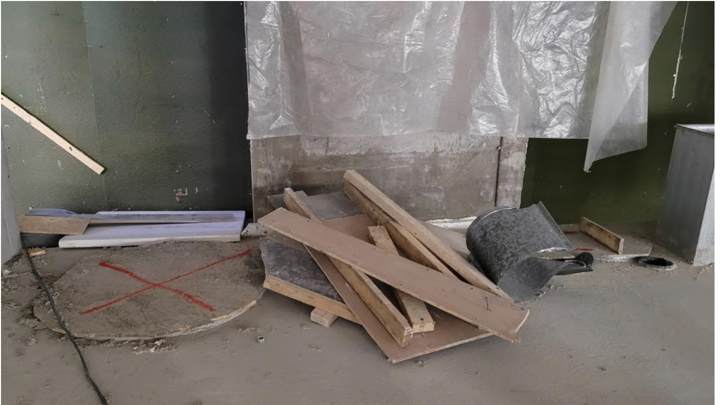
E/A osan välissä olevan IV-konehuoneen aukkosuojan merkintä on nyt korjattu