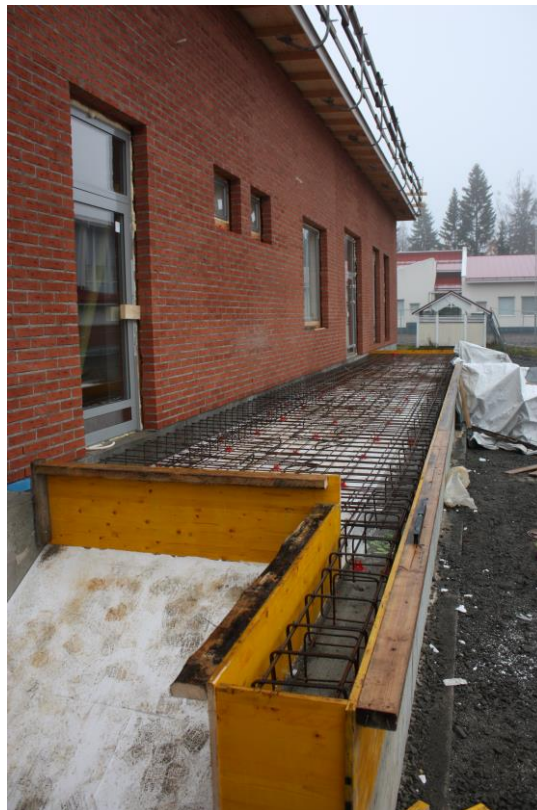
Yläasteen päätykatoksen perustus