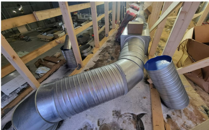
Kuva 6. Liikuntahallin ullakon päädyssä IV-materiaalit nyt säiden armoilla.