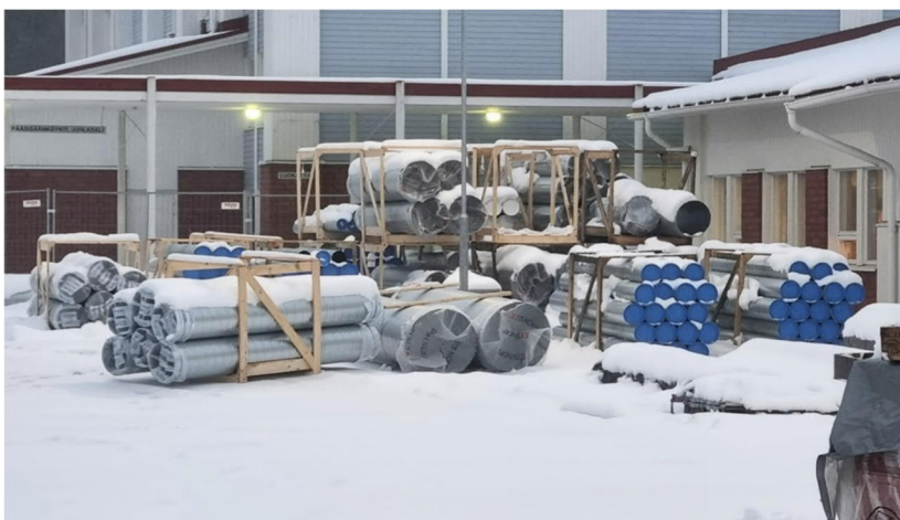
Kuva 7. Yläasteen vieressä piha-alueella IV-kanavat nyt säiden armoilla.