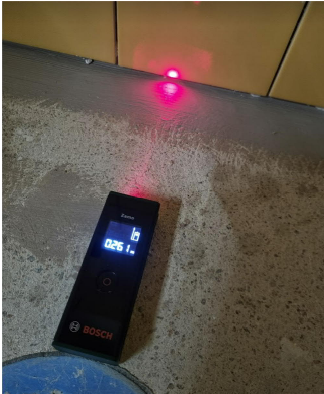
Kuva 1. Yläasteen 1.kerroksen wc-tiloissa lattiakaivo jää melko kauas seinästä. Pesualtaan kytkentäviemäriin olisi syytä jäädä selvästi pesualtaan syvyyssmitan sisäpuolelle, että lattian päällä kulkeva kytkentäviemäri ei olisi altis käytönaikaisille vaurioille.