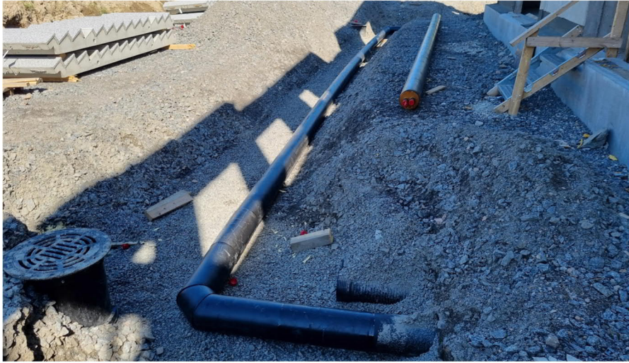
Kuva 4. Yläasteen KL-putkea kaivannossa.