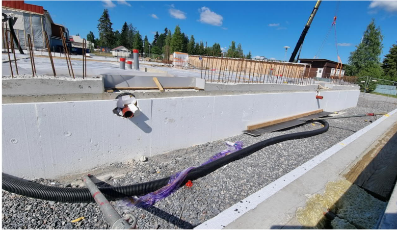
Kuva 7. Liikuntahallin VSS-tilan viemärit toteutettu valuraudalla VSS-kaivolta eteenpäin.