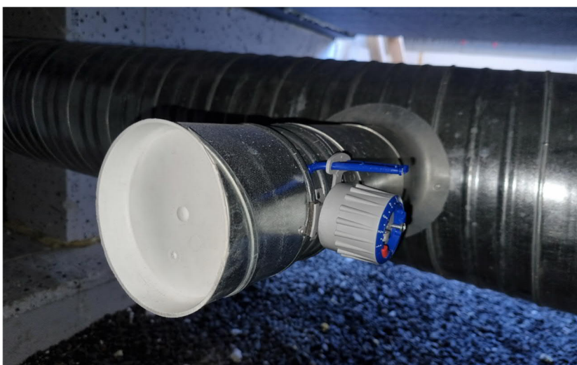
Kuva 3. Yläasteen alapohjan kanava-asennuksia. Kanavat tulpattuna.