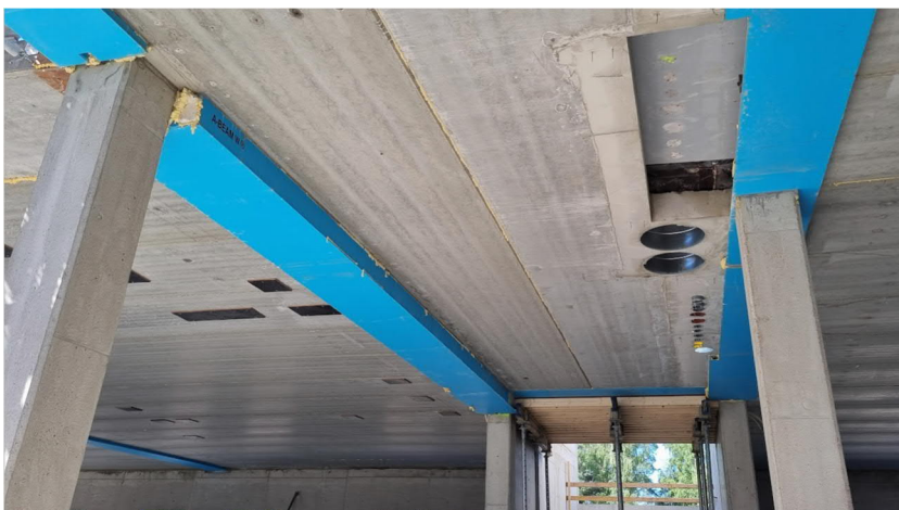
Kuva 2. Yläasteen välipohjissa LVI-varauksia.