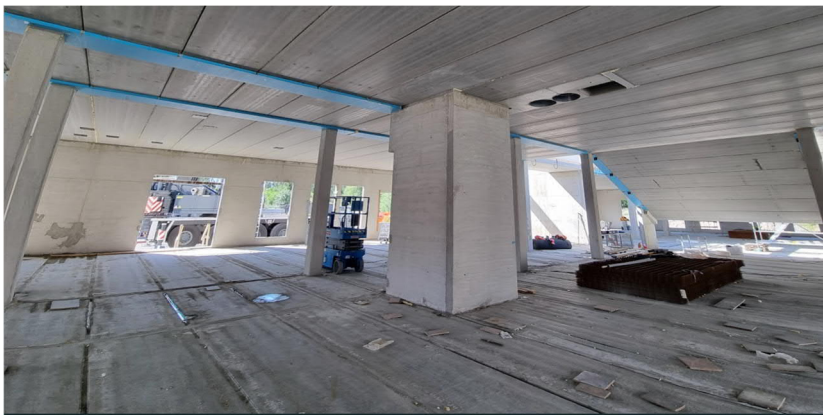
Kuva 1. Yläaste, yleisnäkymä.