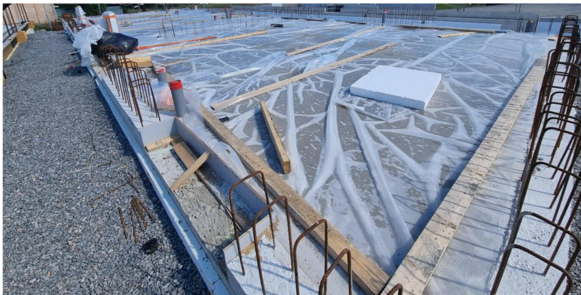
Kuva 8. Liikuntahallin VSS-tilan lattia valettu. Viemärit ja lattialämmitysputket asennettu.