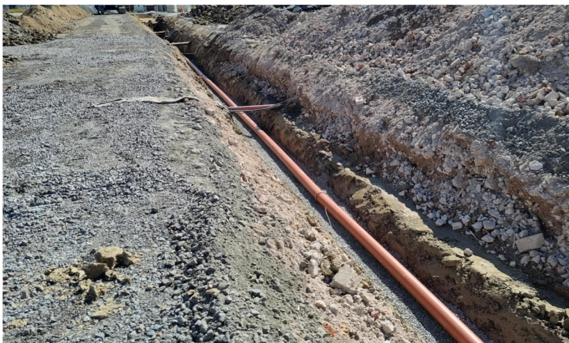
Kuva 9. Kädentaitojen viemärit asennuskaivanto.