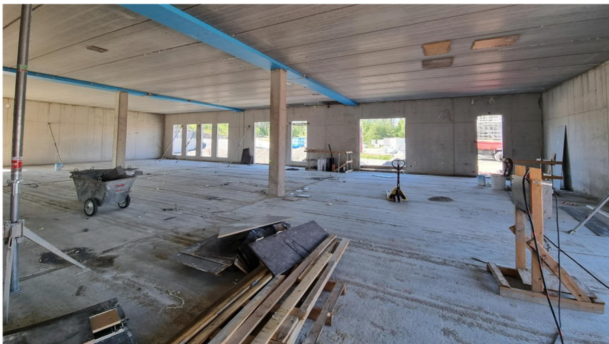
Kuva 6. Kädentaidot, yleisnäkymä.

GRANLUND POHJANMAA OY TIEDEKATU 2 60320 SEINÄJOKI