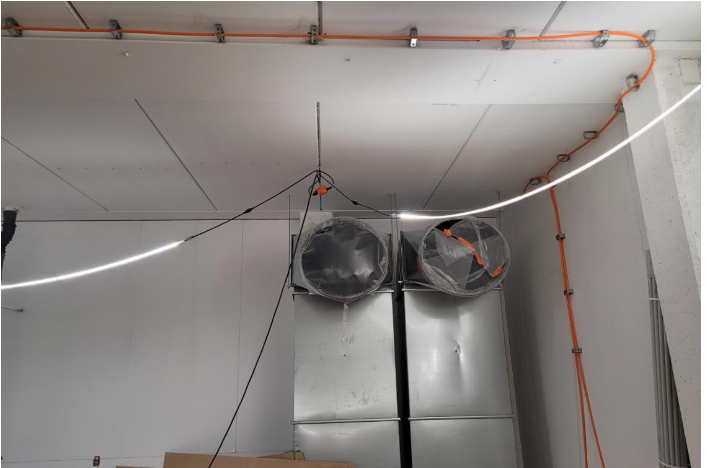
Savunpoistoluukun palonkestävä asennus