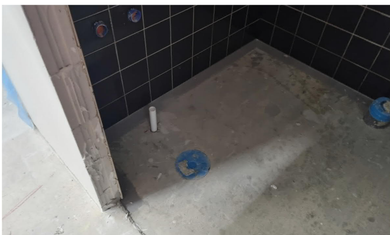
Kuva 5. Kädentaidoissa WC-tilaan tehty uusi viemärireitti pesualtaalle.