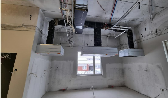
Kuva 6. Yläasteen kotitalousluokkien huuvia asennettuna, alapinta n. 2100mm.

Keskialueella saareke, seinustoilla keittiökalusteiden yläpinta n. 2100mm, suoraan huuvin alle ei asenneta kalusteiden yläkaappeja.