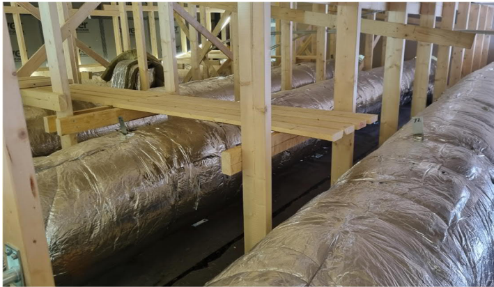
Kuva 1. Liikuntahallin ullakolle kulkusillat käynnissä. Reitit kulkevat puhdistusluukuille.