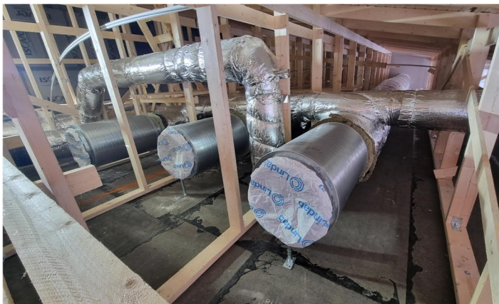
Kuva 2. Liikuntahallin ullakon kanavointeja. IMS:it puuttuvat ja niiden jälkeen kanavat+eristeet.