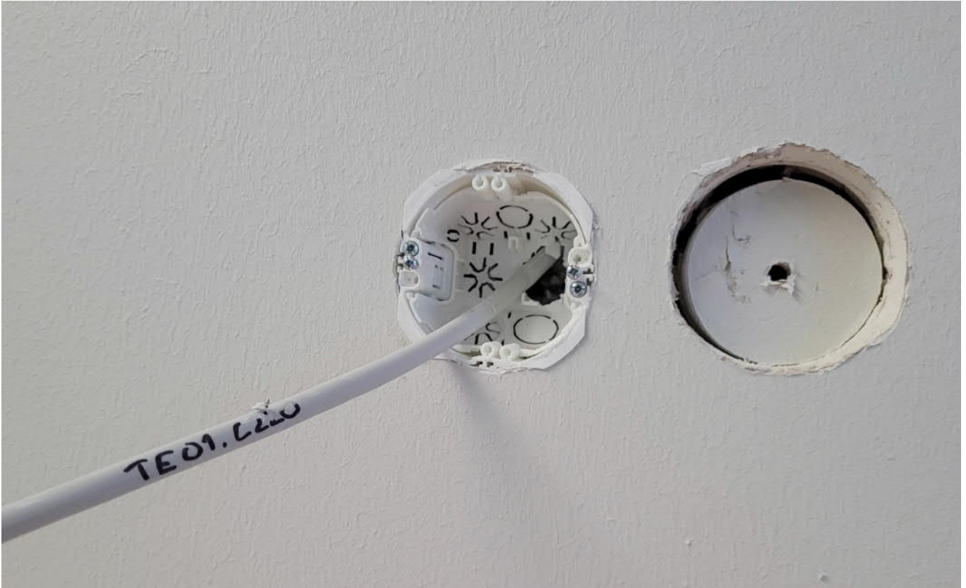
C-osa 2. krs hallintotiloissa vastakkain olleiden rasioiden (katso edellinen valtionraportti) korjaus aloitettu. Tuohon oikeanpuoleiseen vähän paikkaa vielä päälle