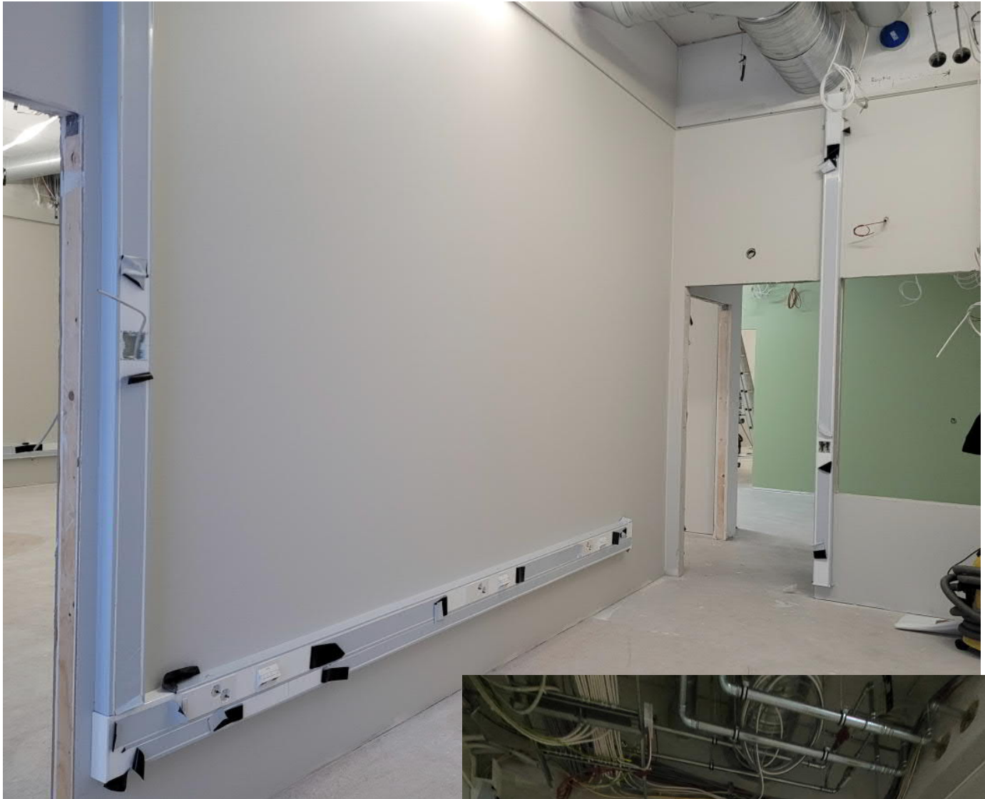
Kouruasennuksia C-osan 2. krs