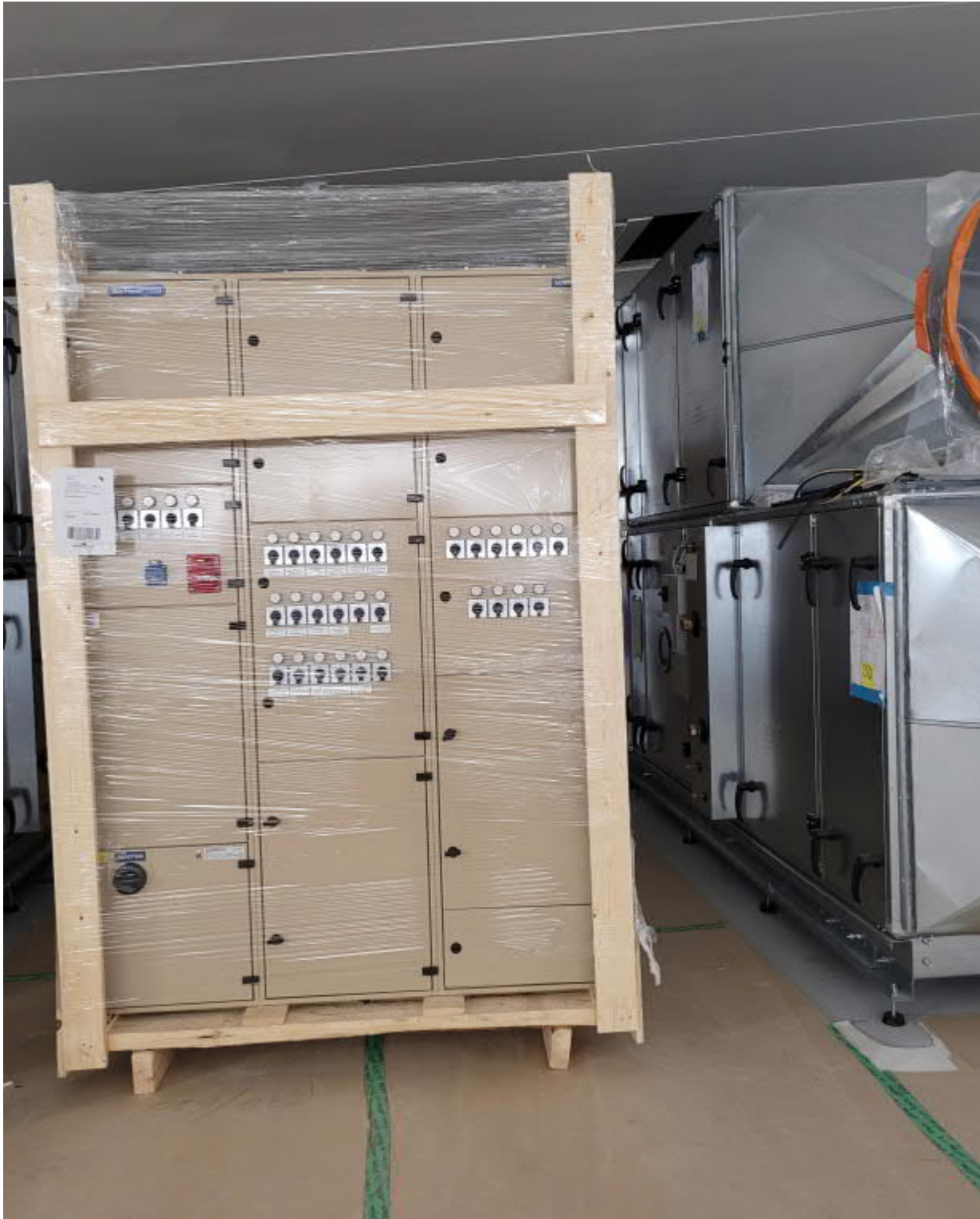
IV-konehuoneen keskus C-osalla