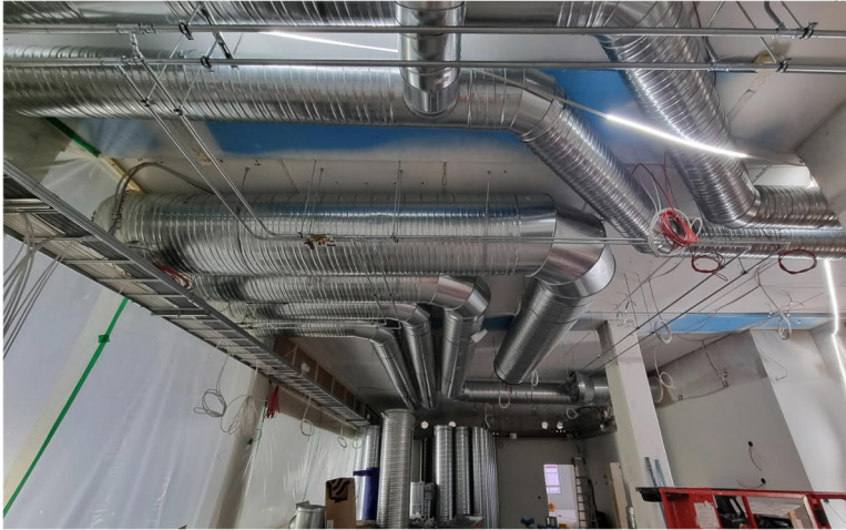
Kuva 7, Yläasteen kanava ja putkiasennukset edenneet.