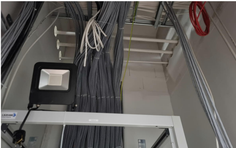
Kuva 8, Yläasteen 2krs teletilan läpi kulkee vesijohdot. Reitti ei ole paras mahdollinen, mutta putket kulkevat yhtenäisenä ilman liitoksia tilan läpi.