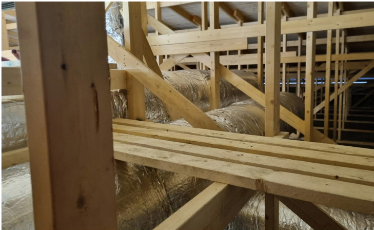
Kuva 2. Kädentaitojen ullakolla kanavat pääosin eristetty ja kulkusiltoja rakennettu.