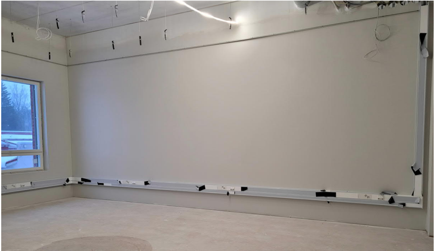
Kouruasennukset on pitkällä C-osan 2. kerroksessa