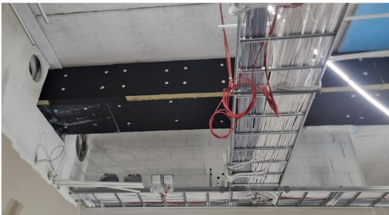
Kuvat 3. Yläasteen kotitalousluokkien rasvaeristystä. Villapinta piiloon teipillä?

GRANLUND POHJANMAA OY TIEDEKATU 2 60320 SEINÄJOKI