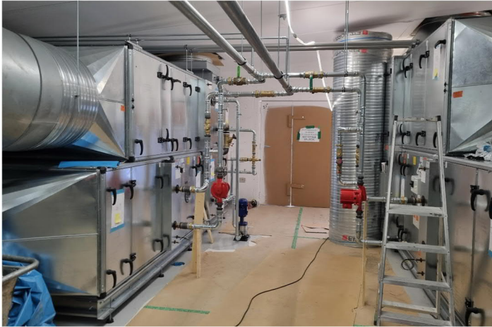
Kuva 6. Yläasteen IV-konehuoneessa kanavoinnit tehty ja putket pumppuryhmineen asennettu.