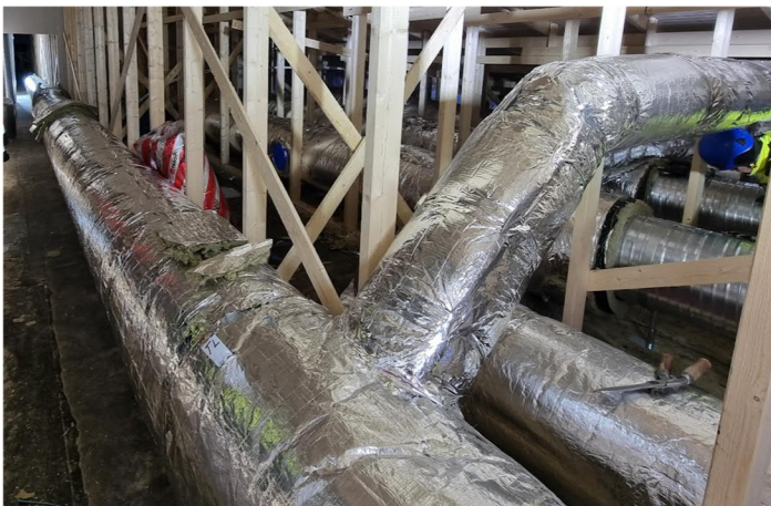
Kuva 2. Liikuntahallin ullakon kanavointeja. Paloeristysten päällä lämpöeristeet. Puhdistusluukut merkattu ja eriste leikattu ja teipattu puhdistusluukkujen kohdissa.