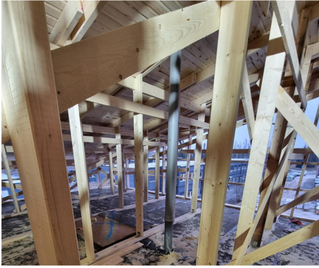
Kuva 1. Liikuntahallin yläpohjassa asennettu tuuletusviemäreitä.