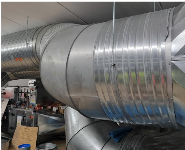
Kuva 4. Yläasteen konehuoneen isoissa kanavissa urakointi käyttänyt ruuvikiinnityksiä?