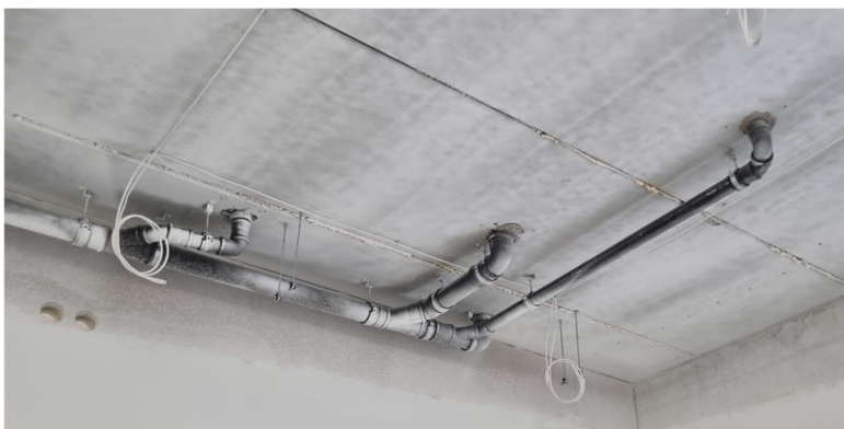
Kuva 5. Yläaste. 1krs katossa osasta viemäriläpivientejä puuttuu palomansetit.