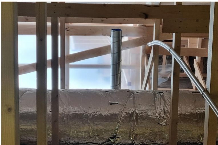
Kuvat 3. Liikuntahallin radon-kanava peltiä, onko materiaalitieto oikea? Monesti radonkanava tehdään muovilla.