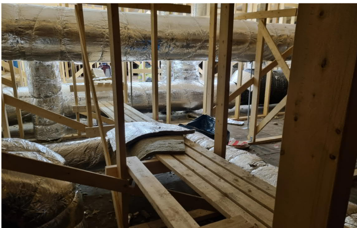
Kuva 3. Kädentaitojen ullakolla kanavat pääosin eristetty ja kulkusiltoja rakennettu.